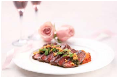
烤澳洲穀飼牛肉眼