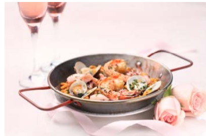
傳統西班牙海鮮麵