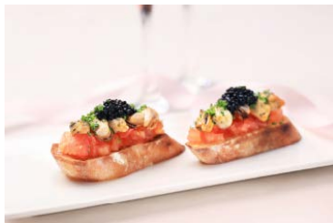
Avruga魚子醬 藍青口傳統吐司