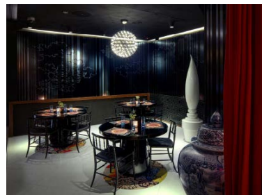
Supergiant Tapas & Cocktail Bar