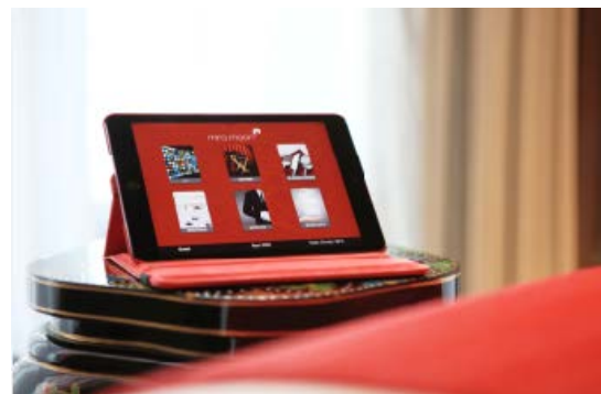
客房內提供 iPad 平板電腦